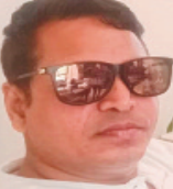
रयाम घायल हैदराबाद

जिंदगी सितम ढाली रही ताउब हम हसते रहे, अश्क छिपा मुस्कुराती कभी तो तुझे पता चलता । पाने की स्वादिष्ट नही की सिर्फ तुम्हे चाहते रहे, किसी को पाकर खोना पड़ता तो तुझे पता चलता । लहलुहान हुए तालवों के छाले तब मंगिल मुकम्मल हुई, किसी सफर में अंगरों पर चलती तो तुझे पता चलता । हैरान हुई हर रैना तिलमिलाती करवटों से लड़ते हुए, चैन सुकून मिट जाता तो नींद का तुझे पता चलता...। जल भून के राख हुआ खाक हुआ मेरा वजूद मेरी हस्ती, कभी समझान के अंगरों से गुजरती तो तुझे पता चलता ।